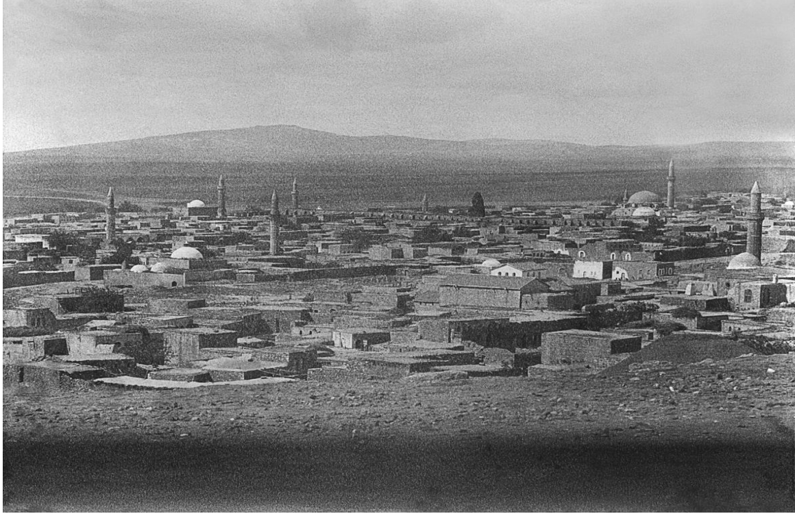
Resim 1: Kilis Şehri'nden Görünüm

1867 ile 1889 yılları arasını ihtiva eden Halep Vilayet Salnameleri'nde; Kilis'in demografik yapısı hakkındaki bilgiler, bazı durumlarda kendi içerisinde tutarlı olmadığı gibi zaman zaman kadınların kayıtlarda yer almamaları, şehir merkezi ile kazanın birbiri yerine kullanılması, vergiden muaf olan veya askerlik hizmeti yükümlülüğü olmayan ya da ulaşamadıkları için sayım memurları tarafından kaydedilmeyen kişiler de göz önüne alındığında nüfus verilerinin sarıh bir şekilde irdelenmesi sırasında karşılaşılan en ciddi sorunlardandır.